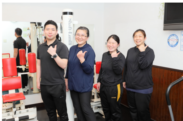
デイサービスみち 鉢塚