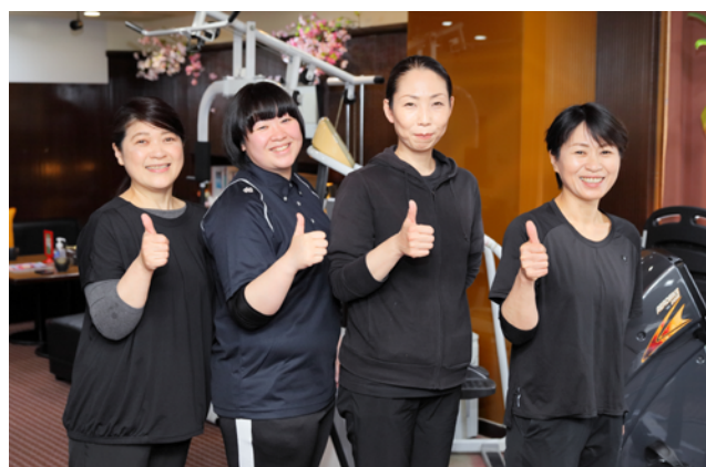
デイサービスみち 上野